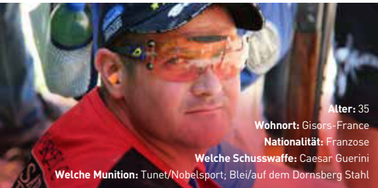
Alter: 35 Wohnort: Gisors-France Nationalität: Franzose Welche Schusswaffe: Caesar Guerini Welche Munition: Tunet/Nobelsport; Blei/auf dem Dornsberg Stahl